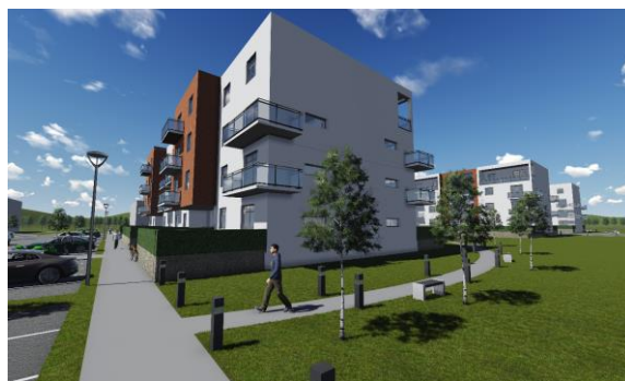
Ondřej Jurák, 4.K