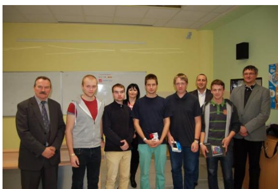
Strojírenská olympiáda 2015