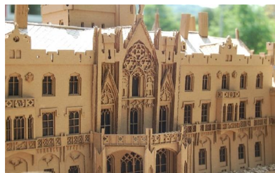
Zámek Lednice z vlnité lepenky