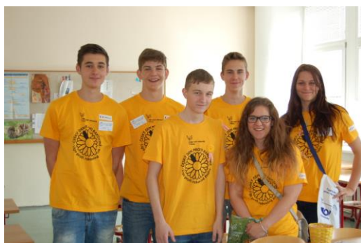
Český den proti rakovině

V březnu uspořádala škola 18. reprezentační ples v hotelu Moskva. Program plesu byl jako každoročně bohatý, vystoupila řada hudebních a tanečních skupin.