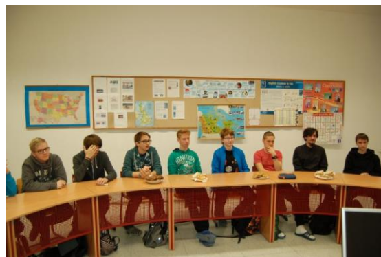
Konverzační soutěž v JAN